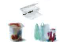
Tous les emballages en plastique