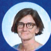
Agnès Firmin Le Bodo

Ancienne ministre de la Santé Présidente de la commission spéciale sur le projet de loi sur la fin de vie