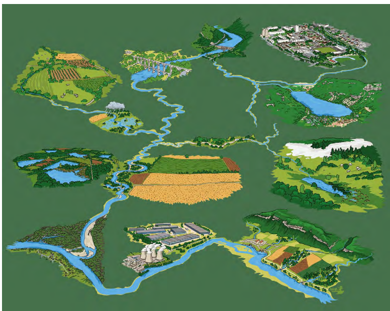
Illustration N°7

Contact au SR3A : Béatrice Leblanc, Chargée de projet SAGE, au 04 74 37 42 80