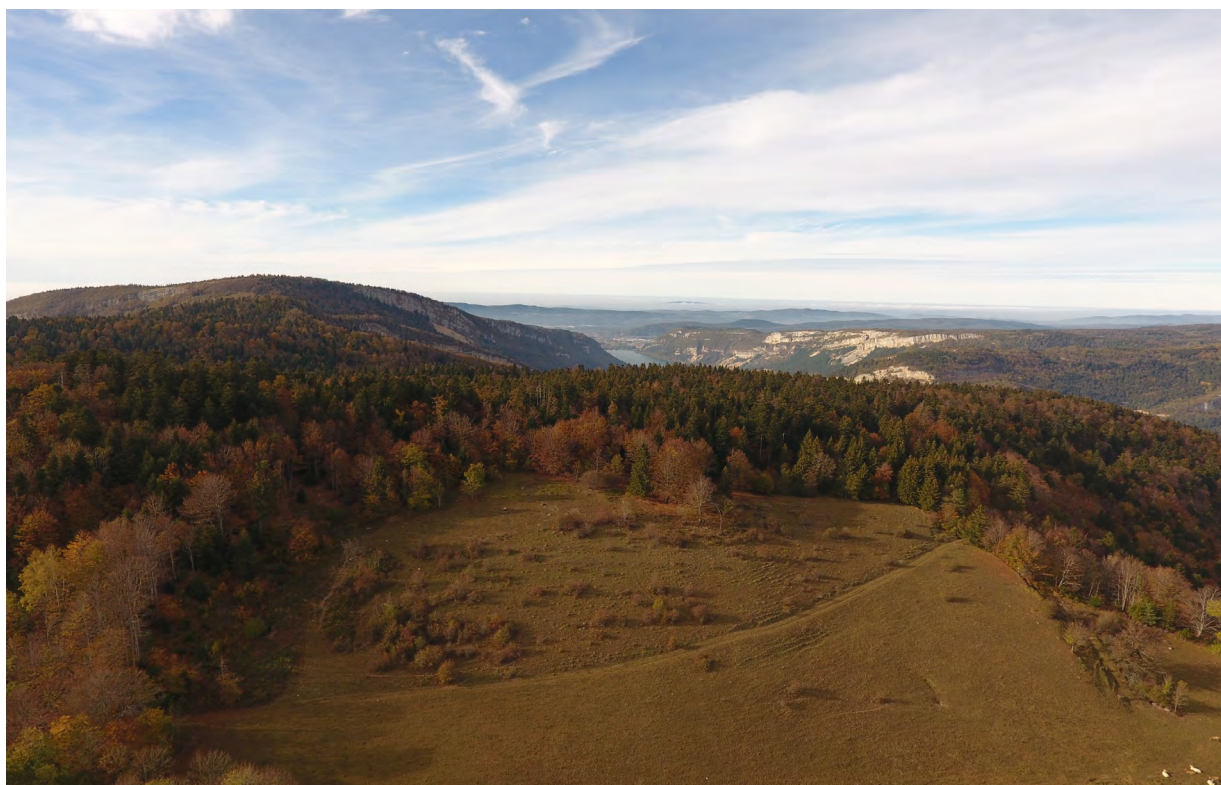
Combe Léchaud - Mention Copyright obligatoire : SR3A