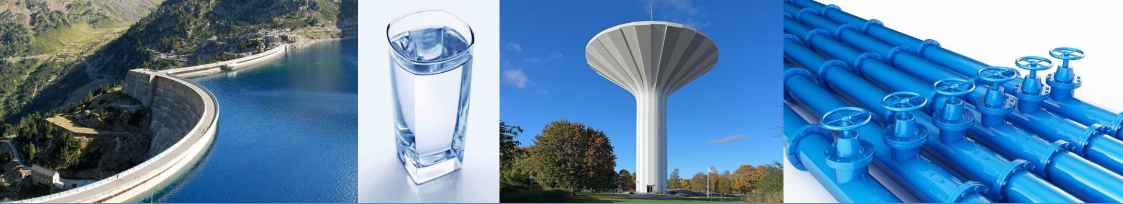
Schéma Directeur d'Alimentation en Eau Potable (SDAEP)