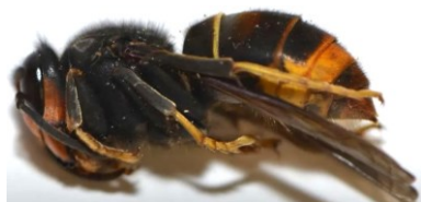
Gyne FA en dormance pendant la phase hivernale