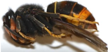
Gyne FA en dormance pendant la phase hivernale