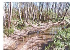
Le site du Gestas

La paroisse est fondée au XI e ou XII e siècle. Cette église romane est dédiée au patron des vigneron. La charpente et la porte sud datent du XVI e siècle.