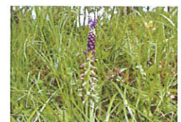
Les orchidées sauvages

Le site du Gestas classé Natura 2000 s'étend sur près de 32km de cours d'eau. Il accueille une grande diversité d'espèces animales et végétales.