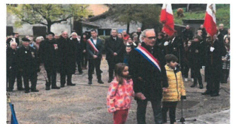
Présence exceptionnelle de Jean-Jacques MICHAU, sénateur de l'Ariège

La population eycheilloise, les enfants du groupe scolaire accompagnés, les autorités civiles et militaires, les élus et agents municipaux se sont rassemblés au Monument aux Morts le 11 novembre dernier afin de rendre hommage à tous ceux qui sont tombés pour défendre la Nation. La cérémonie a été suivie d'un vin d'honneur, offert à tous, dans la salle du village.