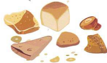
Restes de repas