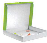
Emballages biodégradables en carton