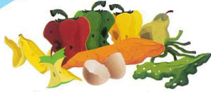
Épluchures, fruits et légumes, coquilles d'œufs