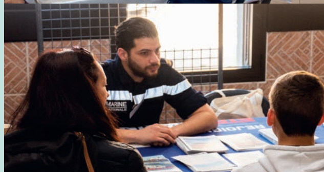
Stand lors du Forum à Villeneuve