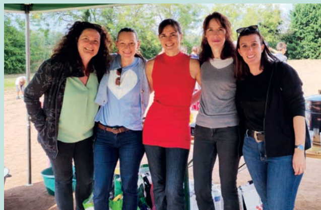
La Team Sou des ecoles