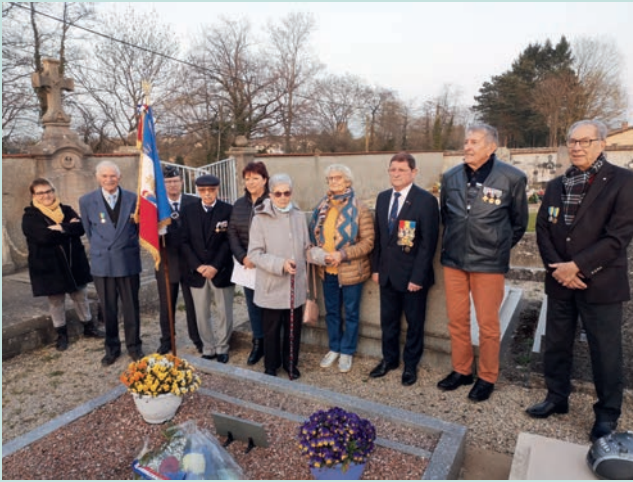
Cérémonie 19 Mars 2022