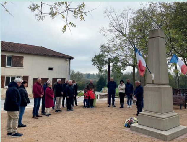
Cérémonie du 11 novembre, place de l'église