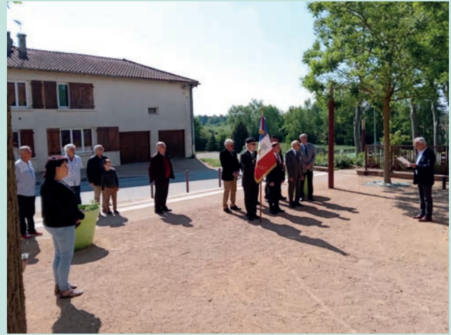
Cérémonie du 8 mai 2022 Monument aux morts, place de l'église