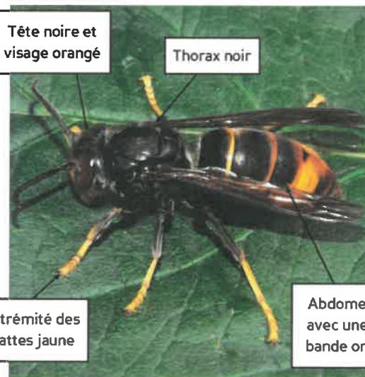
Pierre Falatico, 2012