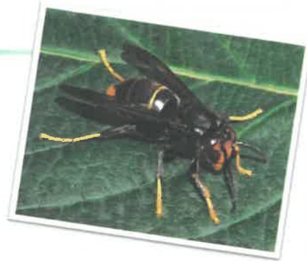
Pierre Falatico, 2013

Le frelon asiatique est très souvent confondu avec le frelon européen. Voici comment les différencier :