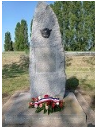
Stèle des aviateurs à Champmaux