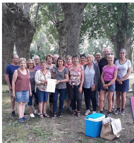
MARCHE ET PIQUE-NIQUE