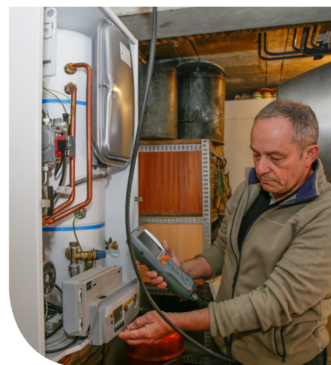
Installateur réalisant un réglage avant passage au gaz H

N°Cristal 09 69 36 35 34 APPEL NON SURTAXE