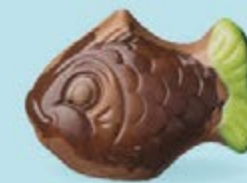
Praliné et noix de coco caramélisée