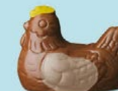
Duo praliné et ganache caramel