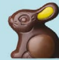
Praliné et éclats d'amandes caramélisées