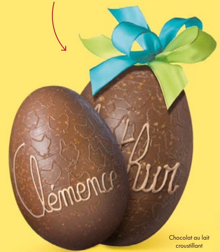
Chocolat au lait croustillant