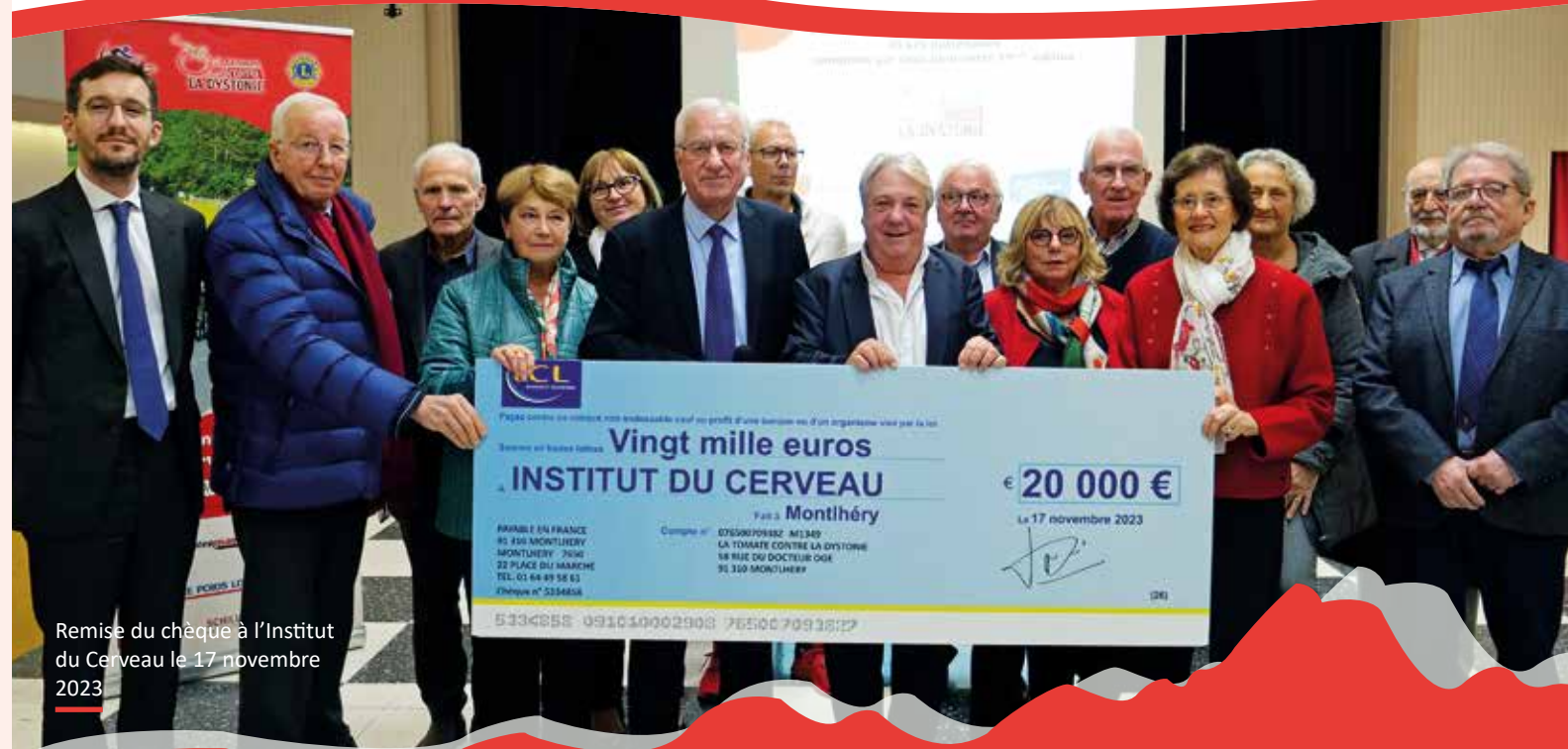
Remise du chèque à l'Institut du Cerveau le 17 novembre 2023