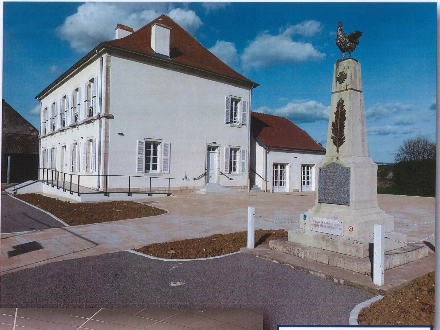
MONUMENT AUX MORTS ACCES COUR EXTERIEURE ESCALIERS ET RAMPE D'ACCES MAIRIE SALLE ANNEXE ENTREE BUREAU DU MAIRE ENTREE DES LOGEMENTS SALLE ANNEXE