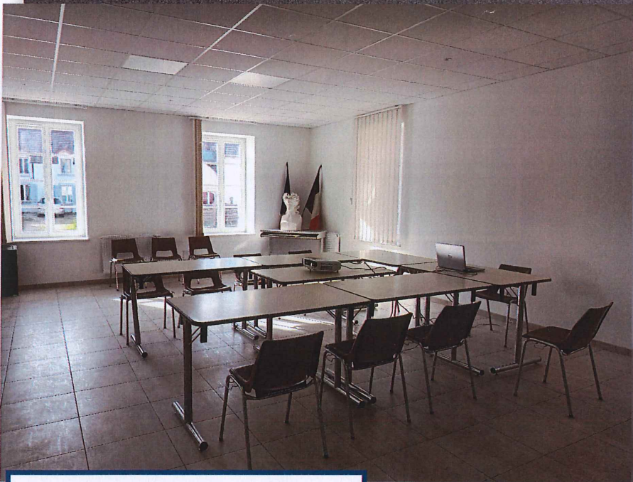
SALLE DU CONSEIL SALLE DES MARIAGES PACS BAPTEMES REPUBLICAINS SALLE DES BUREAUX DE VOTE REUNIONS DIVERSES