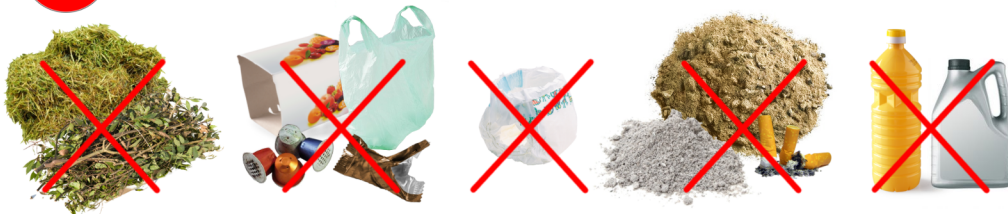
Déchets verts, emballages, couches, cendres, litière, huiles