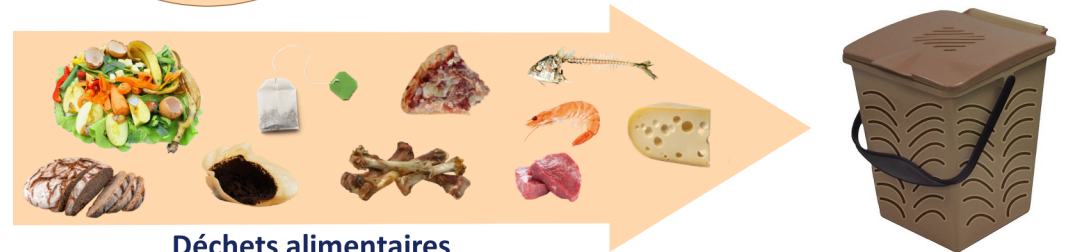
Déchets alimentaires en sac kraft

Nos déchets alimentaires ont de la valeur. Le SMICTOM propose une solution complémentaire au compostage pour valoriser les déchets comme la viande, les produits laitiers et de la mer, difficilement compostables.