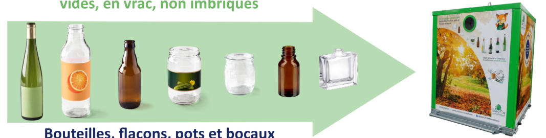
Bouteilles, flacons, pots et bocaux dépôts entre 8h et 20h