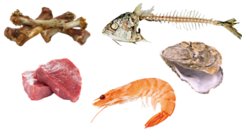
Os, viandes, poissons et produits de la mer