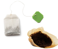
Marc de café et sachets de thé