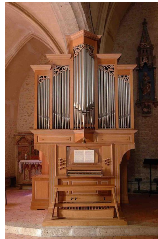
Orgue de la Manufacture M. et G. PESCE - Facteurs d'Orgues