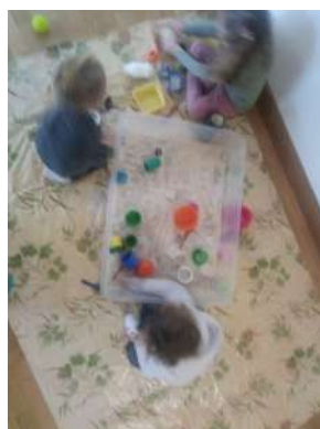
Transvasement - Assier