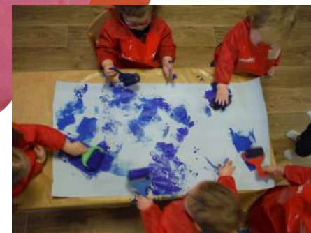
Création d'une fresque d'hiver