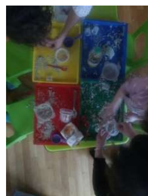
Sable magique - Assier