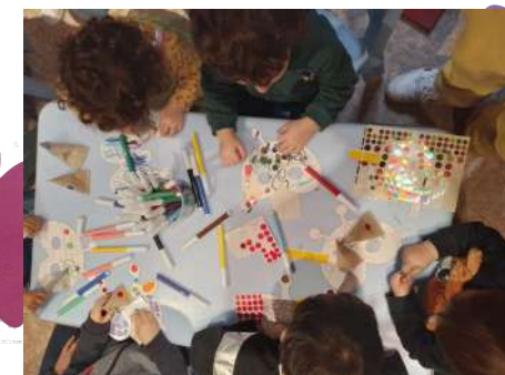
Masque pour Carnaval