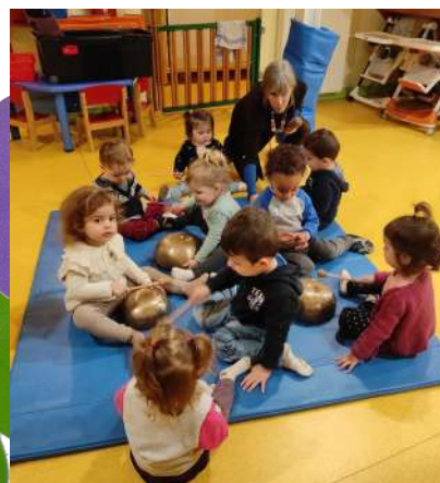
Eveil musical et corporel