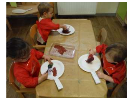
Création d'une poêle à crêpes