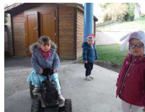
Carnaval à l'école maternelle