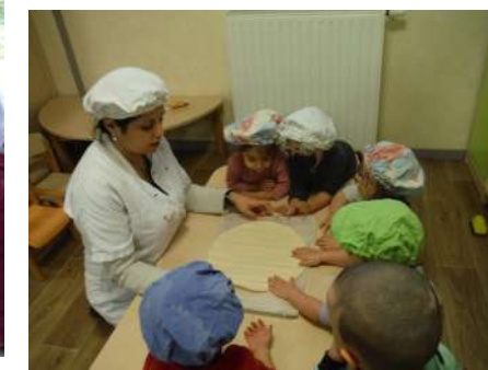
Confection d'une galette des rois