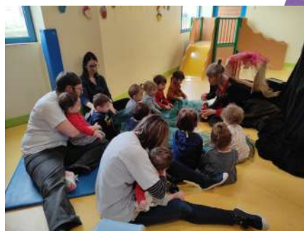
Conte et marionnettes