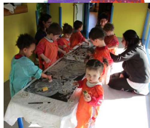
Atelier artistique peinture à l'argile