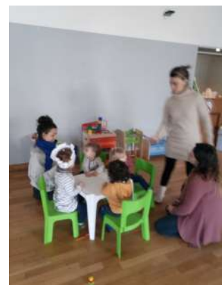
Chandeleur - Assier