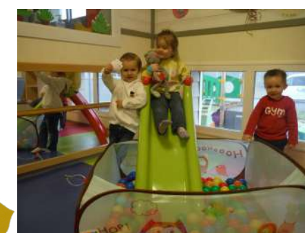
Moustache à la crèche

Le Mercredi 26/06 à 15h30. Nous vous invitons à venir goûter à la crèche pour clôturer l'année scolaire et profiter d'un temps de lecture partagé.