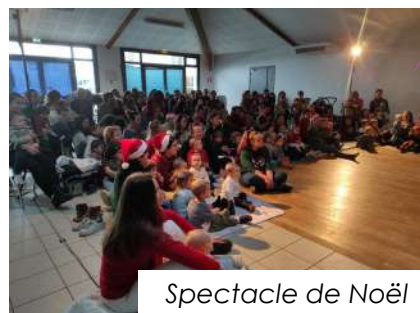
Spectacle de Noël

Le Vendredi 17/05 autour d'une table lumineuse et le Vendredi 21/06 à l'occasion de la fête de la musique.