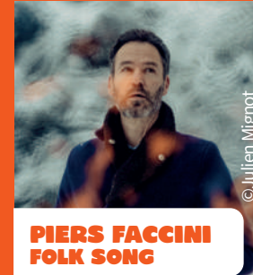
PIERS FACCIANI FOLK SONG

Piers Faccini chante une utopie musicale personnelle, toujours loin des modes et hors du temps. Le songwriter italo-britannique est surtout le citoyen de son propre imaginaire. Passionné des musiques du monde, il compose en fusionnant les genres, s'inspire des répertoires traditionnels, au grès de ses rencontres artistiques. Il nous offre un moment intimiste, unique, privilégié. Le rendez-vous est à ne pas manquer !