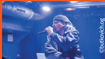
BOURRICOT LIVE BAND URBAN INSTRUMENTAL