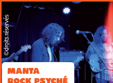
MANTA ROCK PSYCHÉ