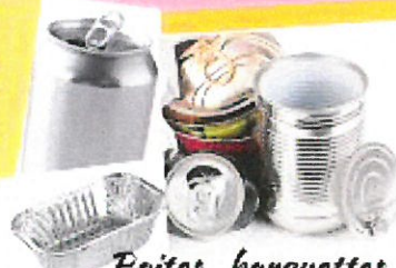
Boîtes, barquettes et canettes en Alu