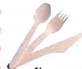
Couverts en bois