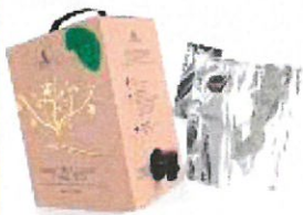
Cubi de vin: carton et alu séparé