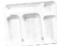
Plateaux repas non -imbriqués