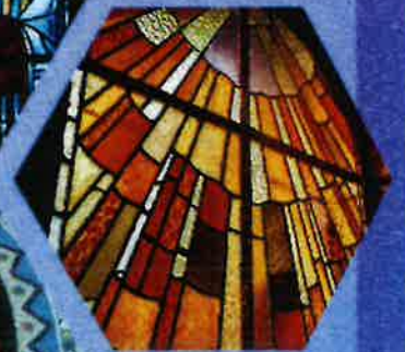
Chapelle latérale - Église Notre-Dame de Moncaumonil

Musée départemental de l'école publique (Aisne)