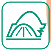
FILMS AGRICOLES USAGÉS

→ Chambre d'agriculture Adivalor Lieux de vente