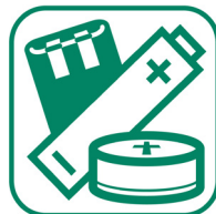
PILES ET ACCUMULATEURS