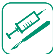
DÉCHETS D'ACTIVITÉS DE SOINS À RISQUES

→ Collecte en porte à porte ou en apport volontaire