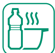
HUILES DE FRITURES