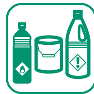
DÉCHETS DIFFUS SPECIFIQUES (DDS)