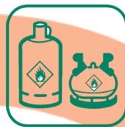
BOUTEILLES DE GAZ