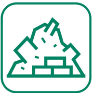
DÉBLAIS / GRAVATS