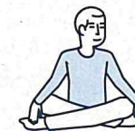
Je fais des activités sans effort