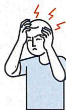
Maux de tête