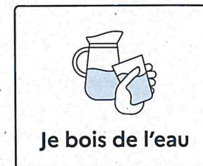
Je bois de l'eau