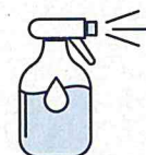
Je mouille mon corps