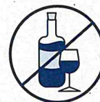
J'évite de boire de l'alcool