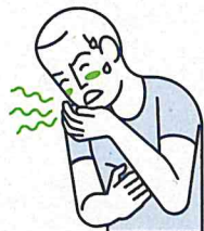
Vertiges / Nausées