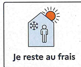
Je reste au frais