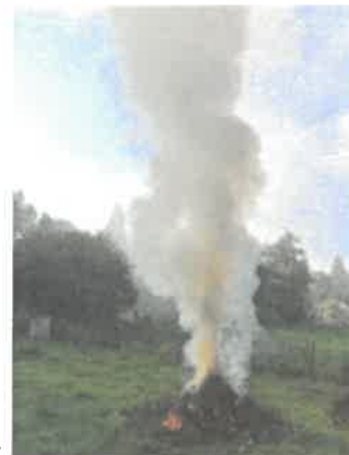
Brûlage effectué par des particuliers

Dans la région Hauts-de-France, la pollution de l'air par les particules fines (PM2.5) est à l'origine de 6 500 décès prématurés par an (source: Santé Publique France, 2016).