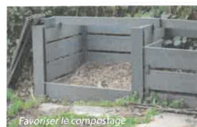
Favoriser le compostage

302 déchèteries réparties sur tout le territoire régional 98 % de la population de la région a accès à une déchèterie