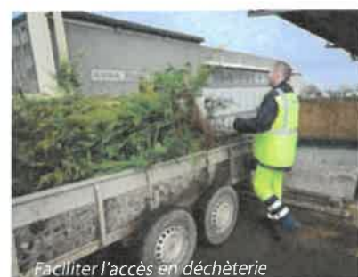
Faciliter l'accès en déchèterie