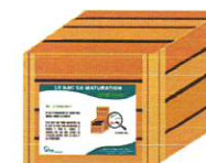
Bac fermé où mûrit le compost.