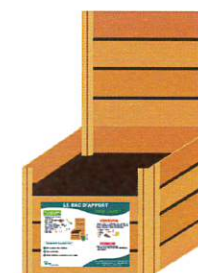
Bac où sont déversés les biodéchets