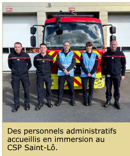
Des personnels administratifs accueillis en immersion au CSP Saint-Lô.

Le Service d'incendie et de secours de la Manche a mis en place une expérience inédite dans le département : un projet d'immersion dans ses cinq centres de secours principaux. L'établissement propose ainsi à des autorités publiques du département et à ses personnels administratifs, techniques et spécialisés de partager le temps d'une demi-journée ou d'une journée le quotidien des sapeurs-pompiers. Revêtus de la tenue de service et d'intervention et en qualité