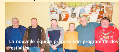
La nouvelle équipe prépare son programme des festivités