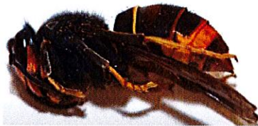
Gyne FA en dormance pendant la phase hivernale