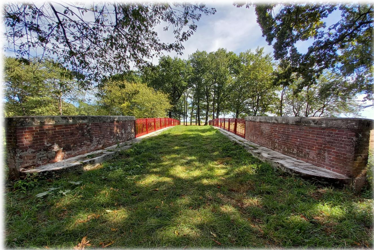
Le pont de Lunay