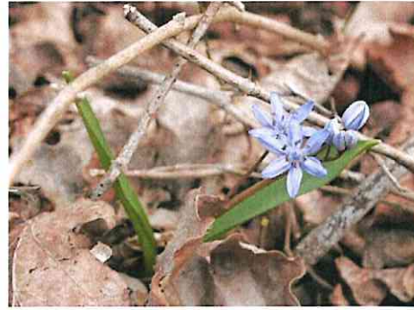
La Scille à deux feuilles

Concernant les oiseaux, vous pouvez rencontrer l'Hirondelle de fenêtre et l'Hirondelle rustique. Ces espèces se sont adaptées aux milieux anthropiques et construisent notamment leur nids sur des bâtiments.