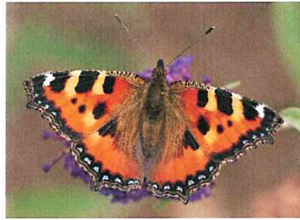
La Petite tortue

Dans les bois, il est possible d'observer l'Ail des ours dont les feuilles sont semblables à celles du Muguet ainsi que la Scille à deux feuilles qui comme son nom l'indique, ne possède que deux feuilles.