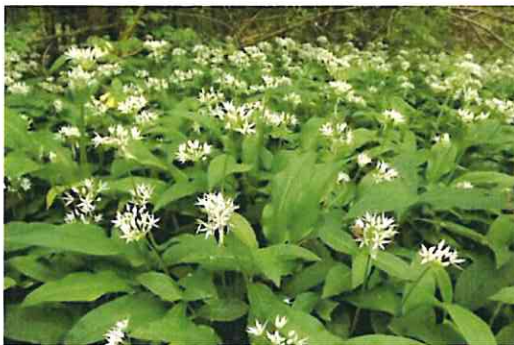
L'Ail des ours

Dans les bois, il est possible d'observer l'Ail des ours dont les feuilles sont semblables à celles du Muguet ainsi que la Scille à deux feuilles qui comme son nom l'indique, ne possède que deux feuilles.