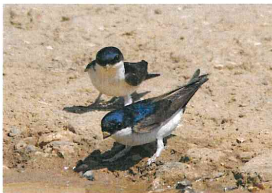
L'Hirondelle de fenêtre

Concernant les oiseaux, vous pouvez rencontrer l'Hirondelle de fenêtre et l'Hirondelle rustique. Ces espèces se sont adaptées aux milieux anthropiques et construisent notamment leur nids sur des bâtiments.