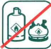
BOUTEILLES DE GAZ