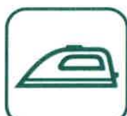
PETITS APPAREILS MÉNAGERS