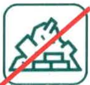
DÉBLAIS / GRAVATS