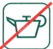
HUILES DE VIDANGE