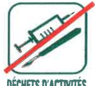
DÉCHETS D'ACTIVITÉS DE SOINS À RISQUES