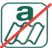
AMIANTE / CIMENT