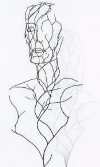
Isabelle Garbil Fauve-Piot

13 rue de la Libération 21400 Châtillon sur seine 03.80.91.10.04