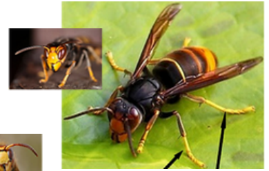
LE FRELON ASIATIQUE