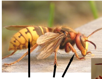
LE FRELON EUROPEEN

Une colonie de frelons asiatiques peut être dangereuse si elle est dérangée, n'essayez pas de détruire le nid par vous-même et gardez une distance de sécurité.