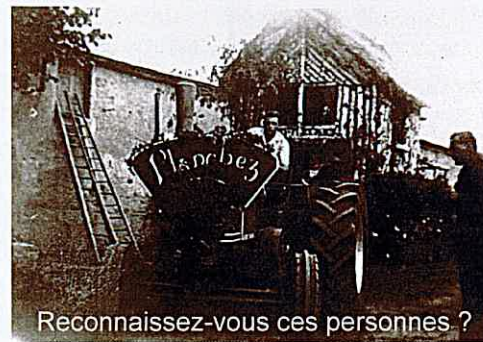
Reconnaissez-vous ces personnes ?

Les 10 et 11 août 2024 le comice agricole se déroulera à Montsauche. Cette fête de la ruralité a lieu tous les six ans au chef-lieu du canton. Elle vise à mettre en valeur les productions locales. Les agriculteurs participent à différents concours : présentation d'animaux, labours, ... Les dernières créations du machinisme agricole sont exposées. Traditionnellement chaque commune du canton réalise un char décoré par les habitants. Cette année le thème est le sport. Un groupe de planchezoises et planchezois est déjà au travail pour réaliser fleurs en papier crépon et divers bricolages. Venez les rejoindre, vous serez les bienvenus. Le jour du comice les chars défilent dans les rues de Montsauche. Autre tradition : l'élection de la reine du comice. Les filles (et les garçons depuis cette année) âgé(e)s de 16 à 25 ans peuvent candidater. Ils se présenteront lors d'une soirée où seront élus une reine, un roi, des dauphins et des dauphines. Le jour du comice ils paraderont sur un char qui leur sera dédié. Si vous le souhaitez vous pouvez encore vous inscrire. Une fête foraine et des bals viendront compléter les réjouissances. PROCHAINE REUNION DE PREPARATION : le 5 avril à 19h30 à la salle des fêtes.