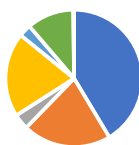
Titre du graphique

TOTAL DEPENSES DE FONCTIONNEMENT 545 650,00