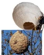
Ne tentez pas de détruire vous-même.

Renouveler l'appât tous les 10 jours. Remettre 3 frelons morts. Déplacer impérativement le piège si trop insectes autres sont piégés