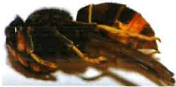
Gyne FA en dormance pendant la phase hivernale