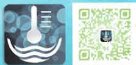
Appli qualité rivière

Découvrez l'état de santé des rivières en France avec l'application mobile de l'agence de l'eau.