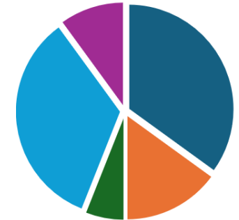
Spectre de proies du frelon asiatique en milieu rural (d'après Rome et al, 2011) F. Muiler MNHN

Abeille 35% Hyménoptère vespidae 15% Autre hyménoptère 6% Diptéra 34% Divers 10%