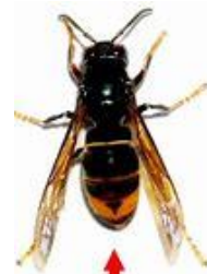
Frelon asiatique (taille réelle 3 cm)