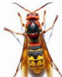
Frelon commun (jusqu'à 4 cm)