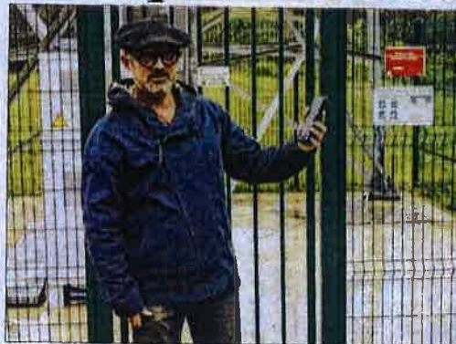
Pas de connexion pour le portable du maire au pied de l'antenne

Ils sont souvent aux abonnés absents. Une fois, le problème devait être réglé rapidement en août, puis dans les semaines qui suivaient, et toujours