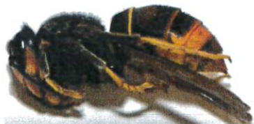
Gyne FA en dormance pendant la phase hivernale