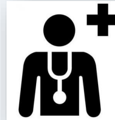
RDV pris en charge par la Sécurité Sociale