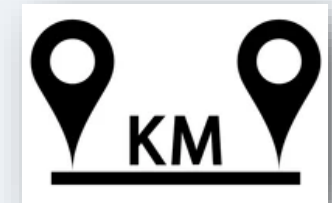
Trajets de moins de 500 m