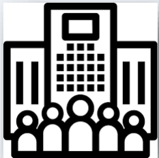
Domicile – Travail