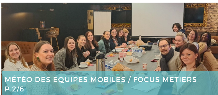
MÉTÉO DES EQUIPES MOBILES / FOCUS METIERS P 2/6