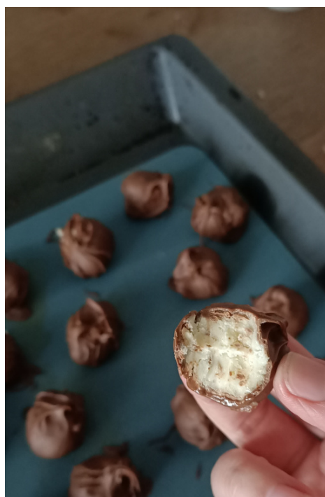
LA BONNE RECETTE D'UNE MAMAN SUPER AIDANTE P 12