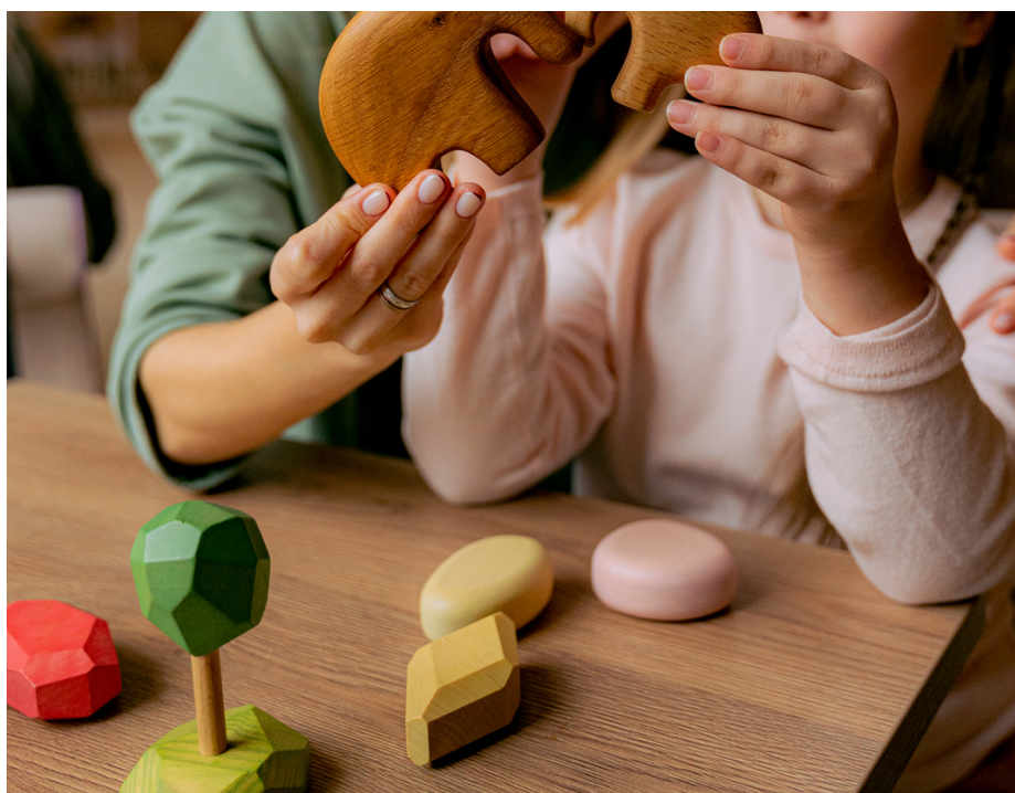
TÉMOIGNAGE D'UNE MAMAN AIDANTE : TRAVAILLER QUAND NOUS SOMMES AIDANT(E) P7/8