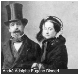
André Adolphe Eugène Disderi