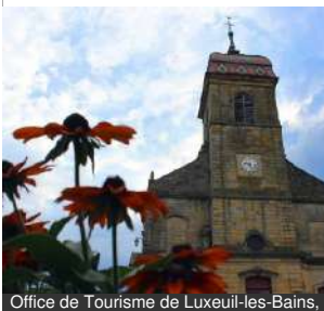
Office de Tourisme de Luxeuil-les-Bains.