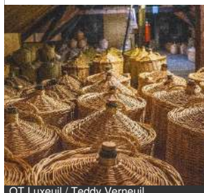
OT Luxeuil / Teddy Verneuil