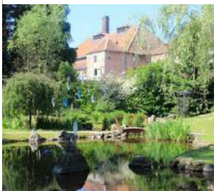
Office de Tourisme de Luxeuil-les-Bains.