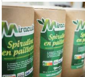
Office de Tourisme de Luxeuil-les-Bains.

le 05/11/2021 de 15h00 à 16h00 et de 16h00 à 17h00