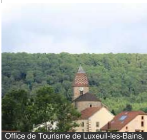
Office de Tourisme de Luxeuil-les-Bains,