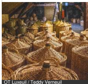
OT Luxeuil / Teddy Verneuil