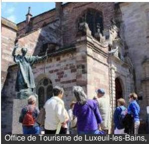
Office de Tourisme de Luxeuil-les-Bains.