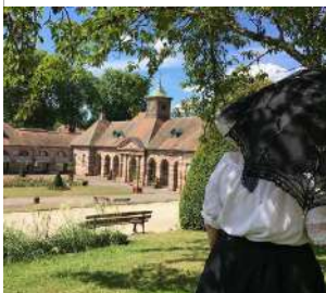
Office de Tourisme de Luxeuil-les-Bains,