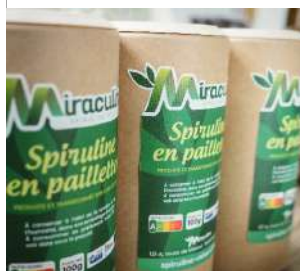
Office de Tourisme de Luxeuil-les-Bains,

le 26/11/2021 de 15h00 à 16h00 et de 16h00 à 17h00