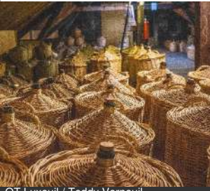
OT Luxeuil / Teddy Verneuil