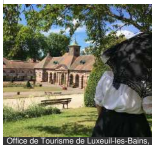
Office de Tourisme de Luxeuil-les-Bains,