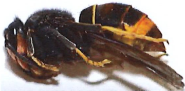
Gyne FA en dormance pendant la phase hivernale