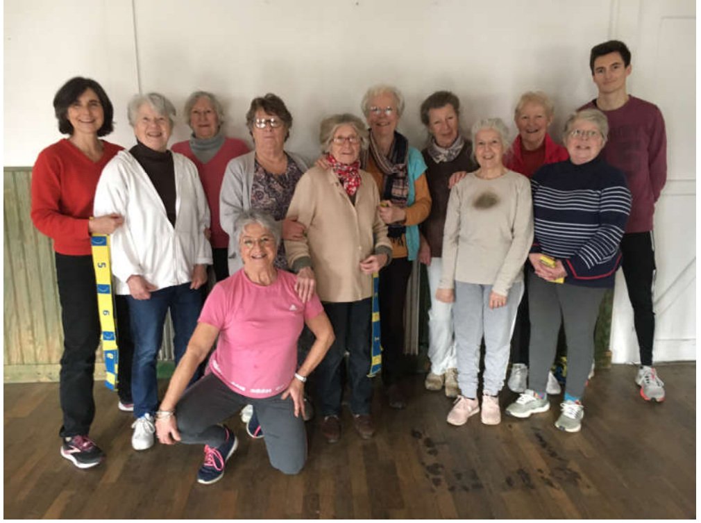
Une douzaine de personnes s'adonnent à la gymnastique adaptée le vendredi avec 1 moniteur

Les possibilités de chaque participant et l'autonomie de la personne sont strictement respectées.