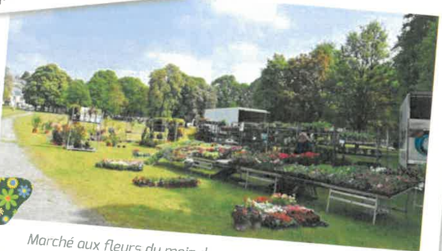
Marché aux fleurs du mois de mai sur la place de Launet.