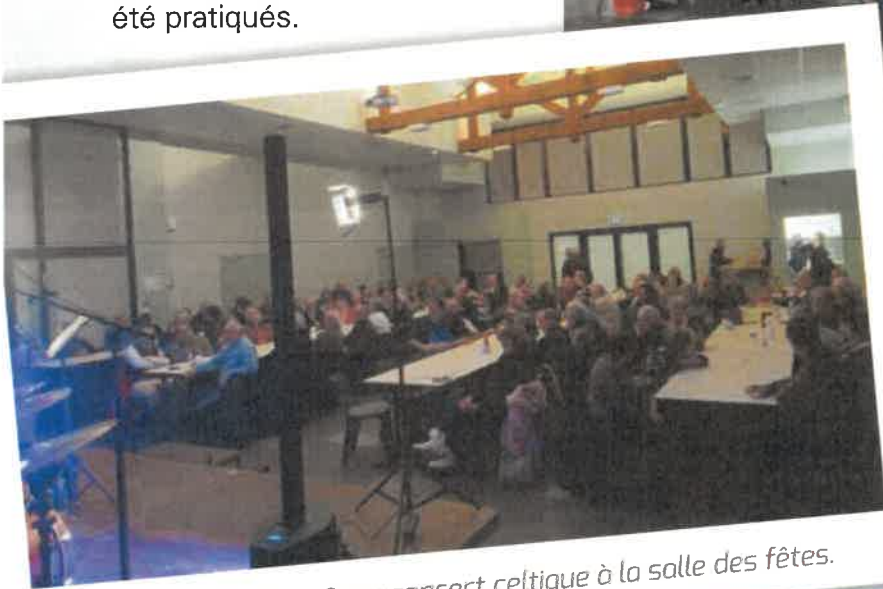
Mars 2023 : Magnifique concert celtique à la salle des fêtes.

Et le Maire a même poussé la chansonnette en interprétant C'est extra de Léo Ferré.