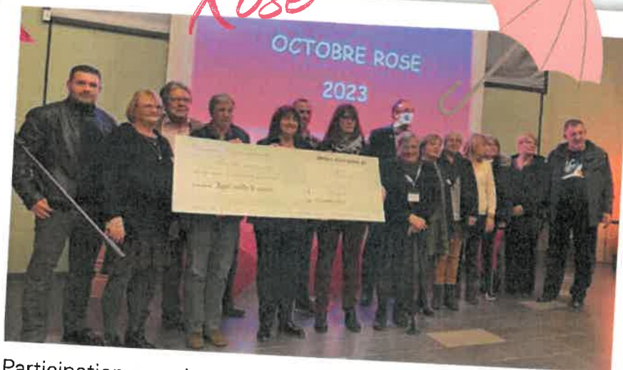
Participation pour la seconde année avec les associations du village à octobre rose, en commun avec les communes de Haybes, Fumay ainsi que le centre social de Fumay avec la remise d'un chèque de 6195,73 € à la ligue contre le cancer.