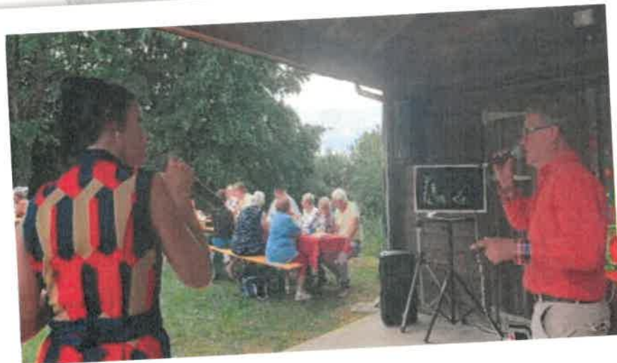
21 juin : Fête de la musique dans les jardins de la salle du château