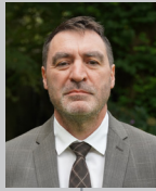
PRÉFET DU FINISTÈRE Alain ESPINASSE