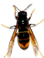
Frelon asiatique (taille réelle 3 cm)

Ce redoutable prédateur s'attaque à toutes sortes d'insectes, mais principalement aux abeilles, maillon indispensable dans la chaîne alimentaire !