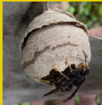
Nid primaire du frelon asiatique