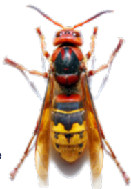
Frelon européen (taille réelle 4 cm)